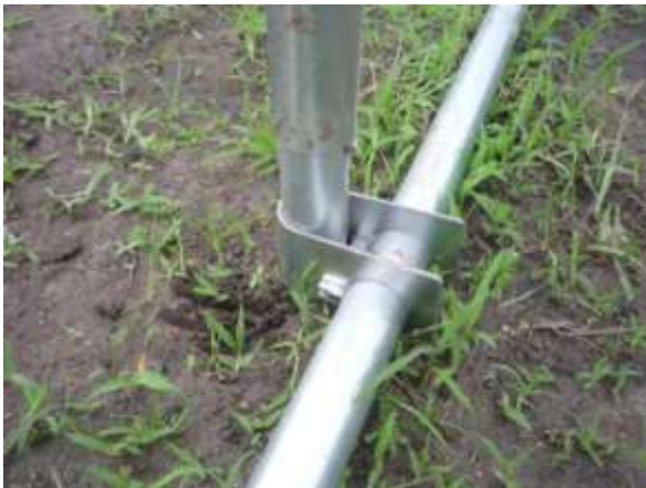
【沈下防止 地際パイプ】