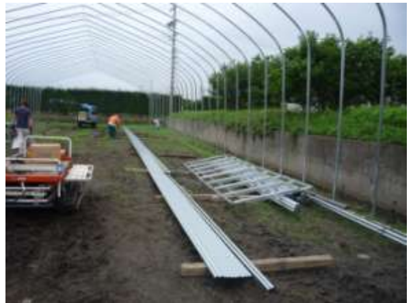
【配材・取付位置墨付】