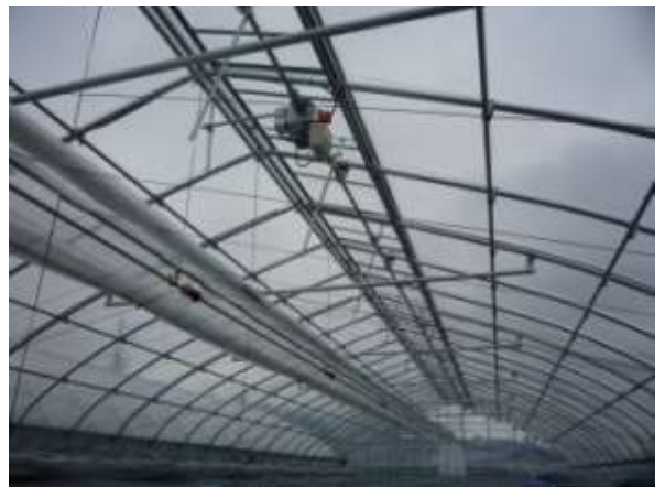
【ラック&ピニオン方式 天窗】