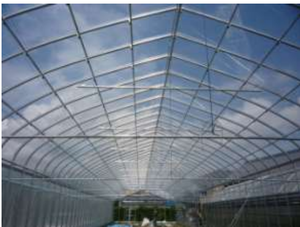
【フッ素フィルム展張仕様 P=750mm】