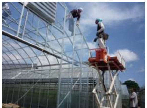
【フッ素フィルム展張風景】