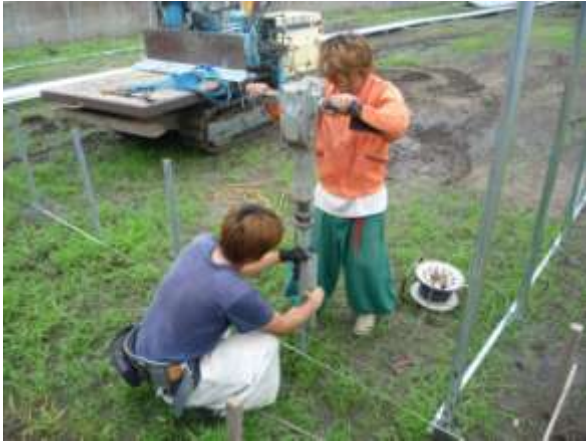
【基礎パイプ 1000mm 機械打ち込み】